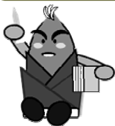
イメージキャラクター たけのこ君

夏本番を迎え、連日、暑い日が続いていますが、皆様、いかがおすごでしょうか？ 今年も残暑も厳しいとのことですから、しばらくの間はうまく暑さをしのいで、何とか涼しい秋を迎えたいものですね。 さて、それでは今月のニュースに移りましょう。